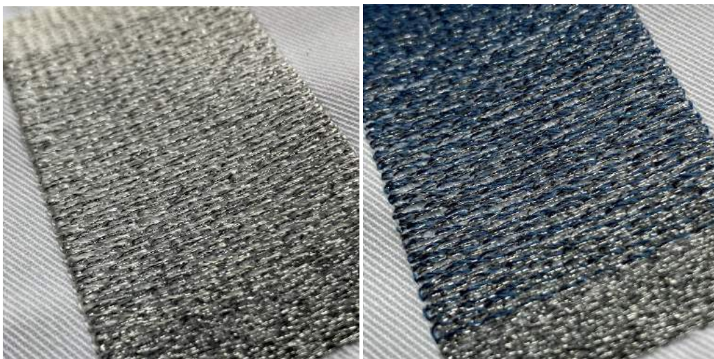
Gestickte Farbverläufe (westsächsische Hochschule Zwickau)

Degradé Effekte, gewoben, gedruckt und natürlich auch gestickt, veredeln auf raffinierte und edle Art und gerade in der Stickerei zeigt sich hier auch die Erfahrung bei der Digitalisierung.