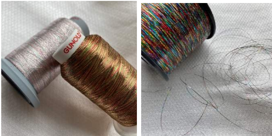
Multicolor Effektgarne aus dem Hause Gunold (Mety / Glitter)

Degradé Effekte, gewoben, gedruckt und natürlich auch gestickt, veredeln auf raffinierte und edle Art und gerade in der Stickerei zeigt sich hier auch die Erfahrung bei der Digitalisierung.