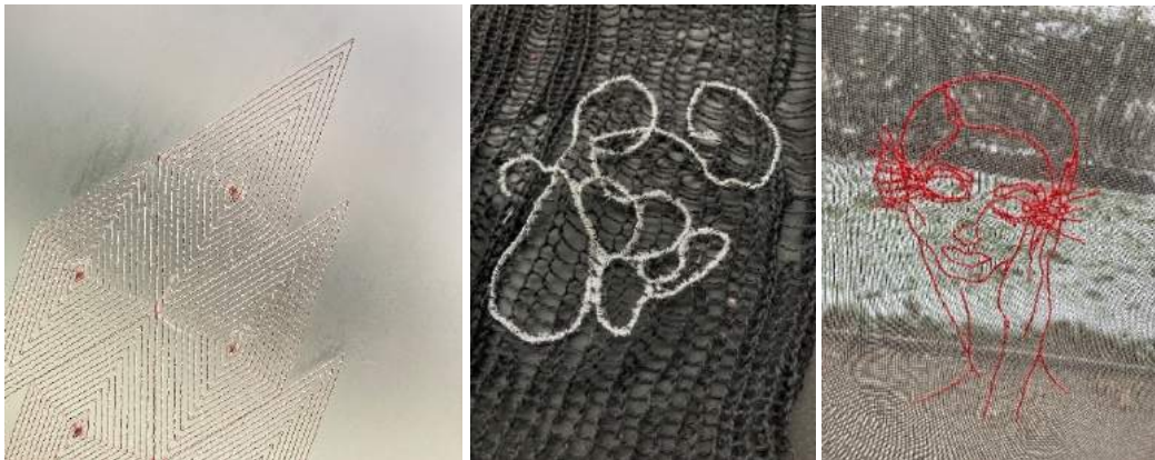
Links: Stickerei auf milchig-matter Folie (Design: GS UK)

Transparenz, Transparenz, Transparenz – an diesem Thema kommen wir auch im Sommer 2024 nicht vorbei – in allen Variationen wird mit durchscheinenden und durchsichtigen Materialien und Effekten gespielt, gerne auch in der Kombination mit hochglänzenden Elementen aller Art.